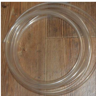
Труба 1 и 3